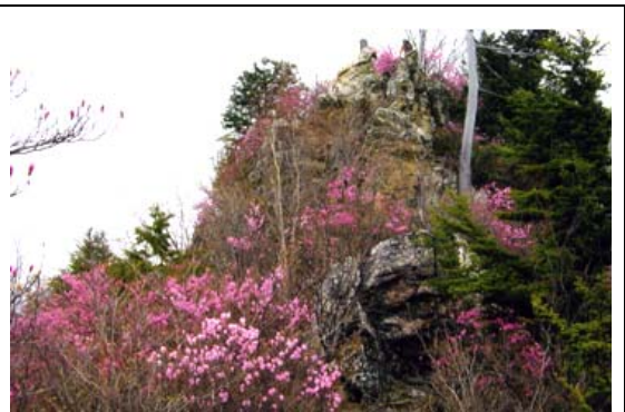
アカヤシオツツジの咲く両神山(5月)

昭文社:山と高原地図「雲取山・両神山」 1/25000 地形図:「両神山・中津峡」